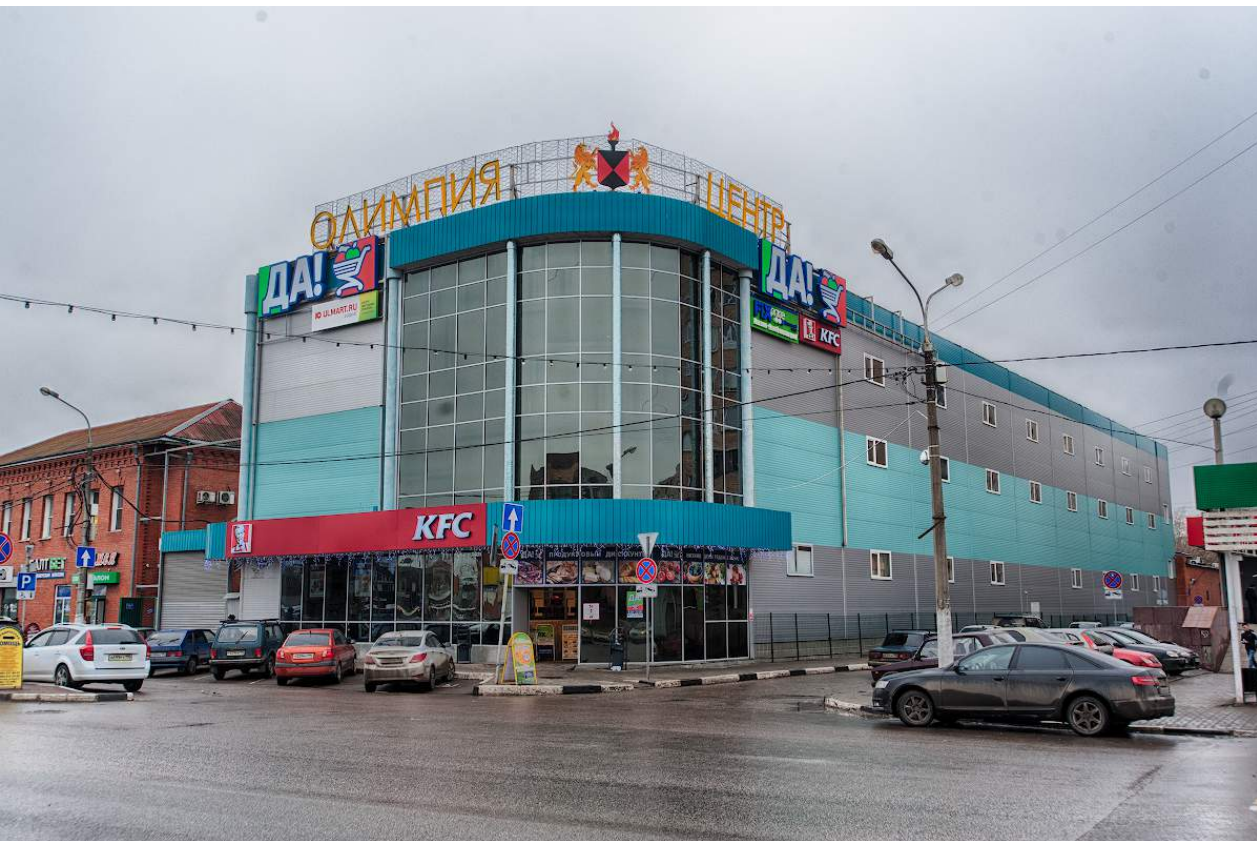
ТЦ «ОЛИМПИА» г. Орехово-Зуево GBA - 18 000 кв.м. GLA - 12 000 кв.м. Девелопер - ТД «Автомобили» Разработка коммерческой концепции Брокеридж