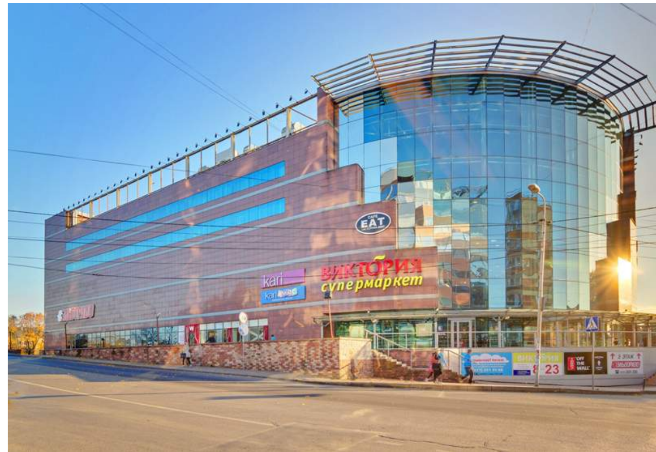
MEGA CENTRE MALL Kaliningrad GBA - 93 000 sq.m. GLA - 59 000 sq.m. Developer - SRV 360 Brokerage