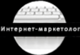
Реклама Владивосток 95,7%