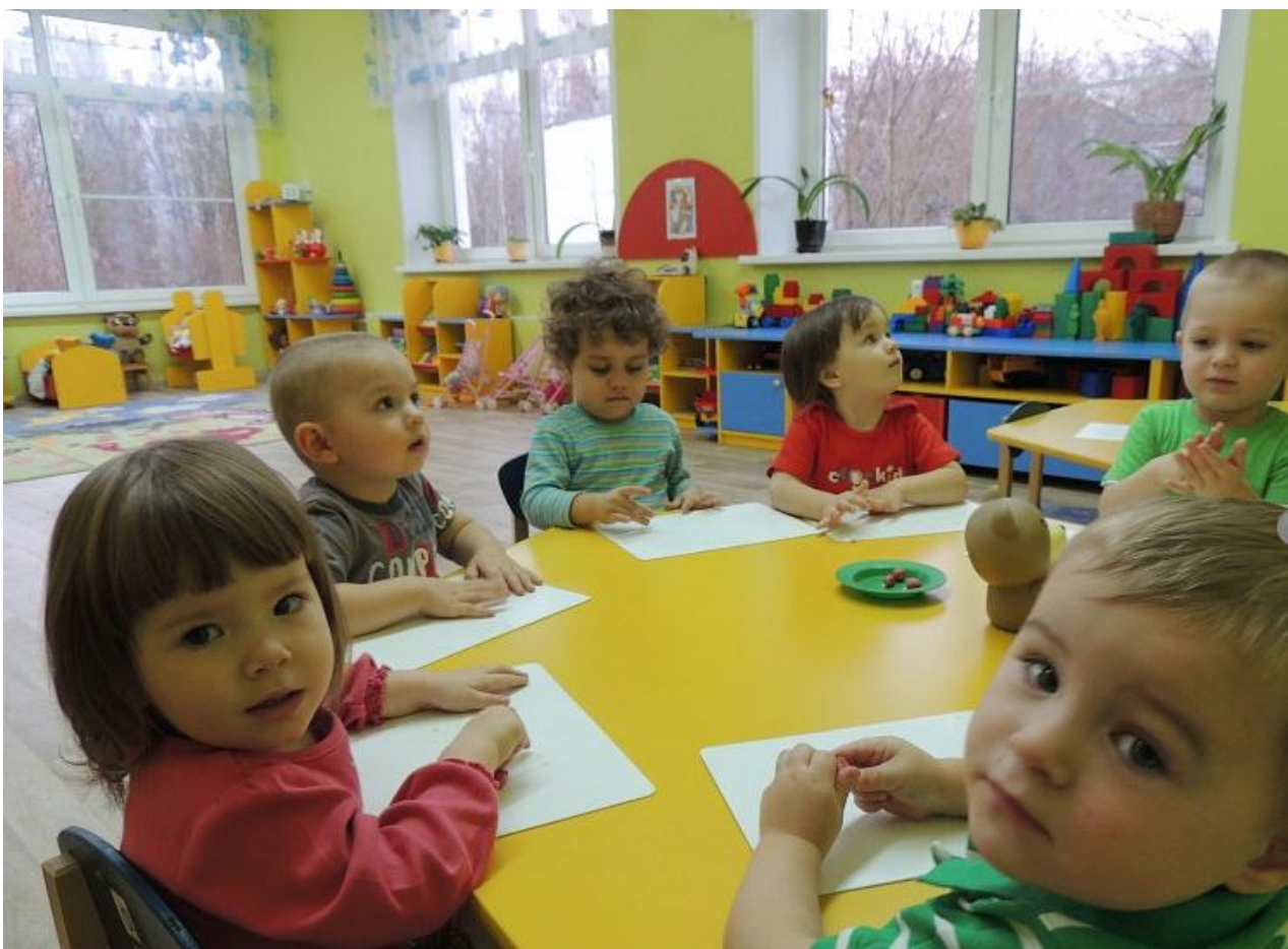
«Нам интересно!» – занятия в частном детском саду «Светлячок», Москва, р-н Лиазново