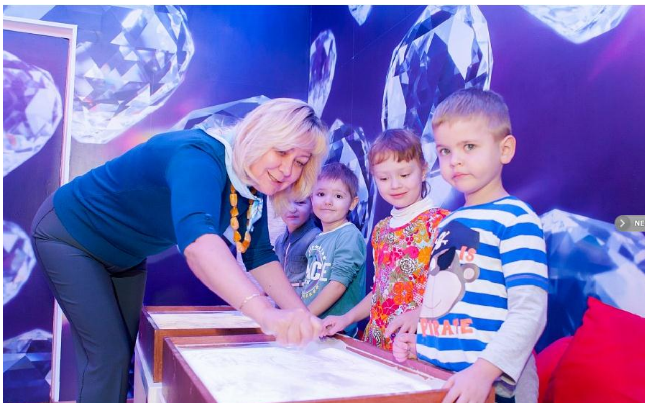
Занятия по программе художественного воспитания «Цветные ладошки» в частном д/с «Жемчужинка», ВАО, Москва

Составляя такие программы, авторы применяют различные педагогические и психологические техники.