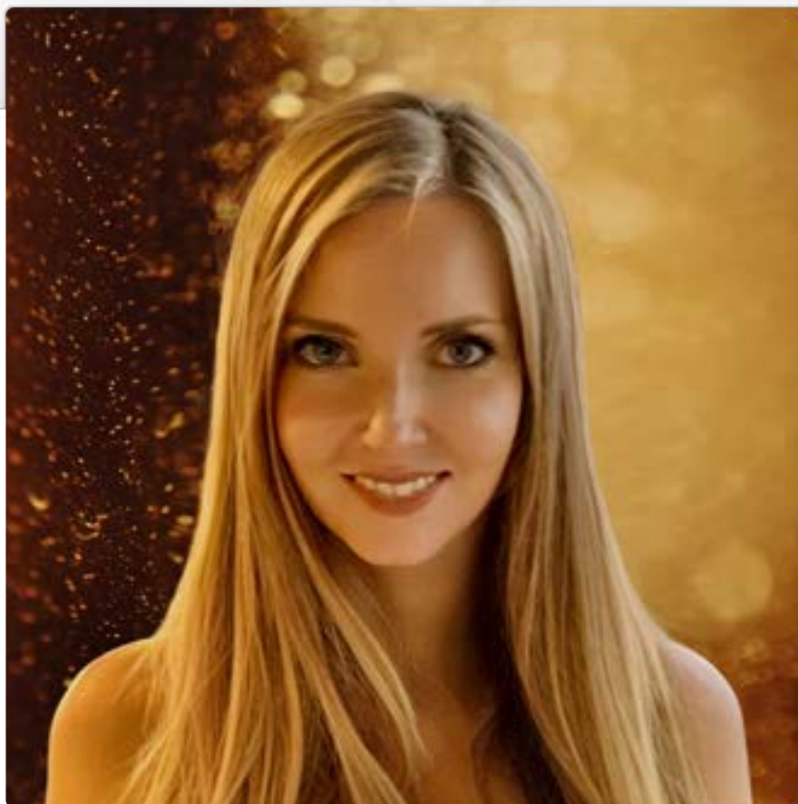
Дизайн человека от Элизабет Биттон