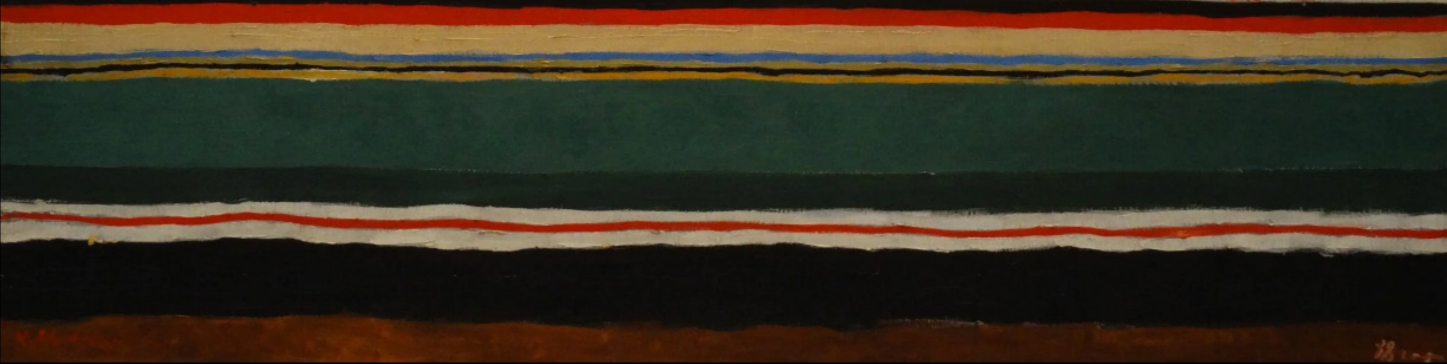
Казимир Малевич Скачет красная конница