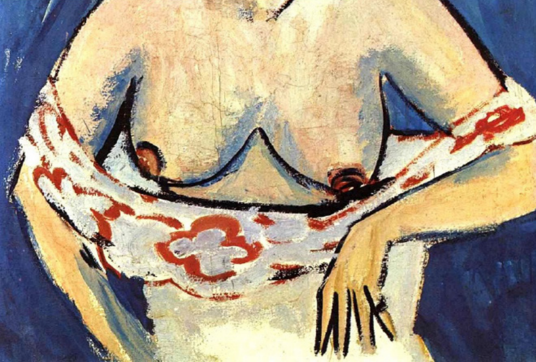
Эрнст Людвиг Кирхнер Полубнаженная женщина в шляпе