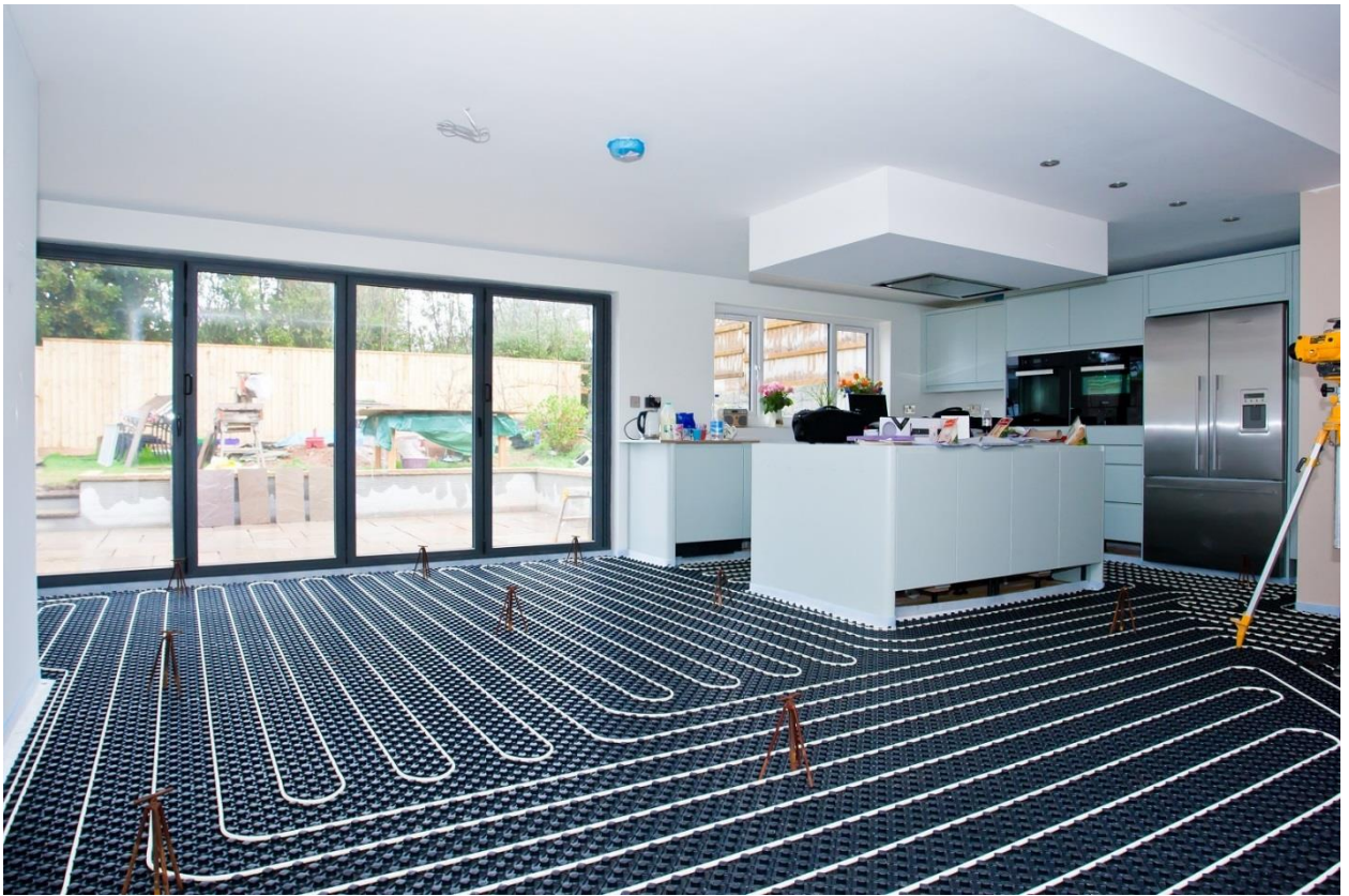
Установка системы «теплый пол»