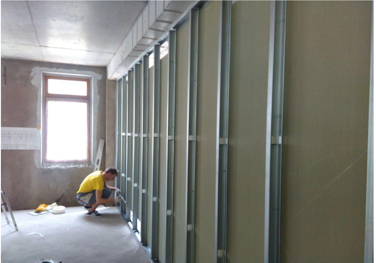
Установка стен из гипсокартона