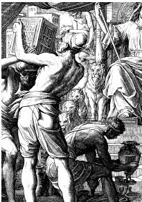
Соломон и царица Савская