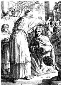
Помазание Соломона на царство