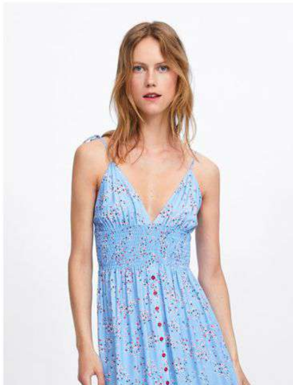
ПЛАТЬЕ-РУБАШКА ИЗ ХЛОПКА И ШЕЛКА С ПОЯСОМ 10 000 Р