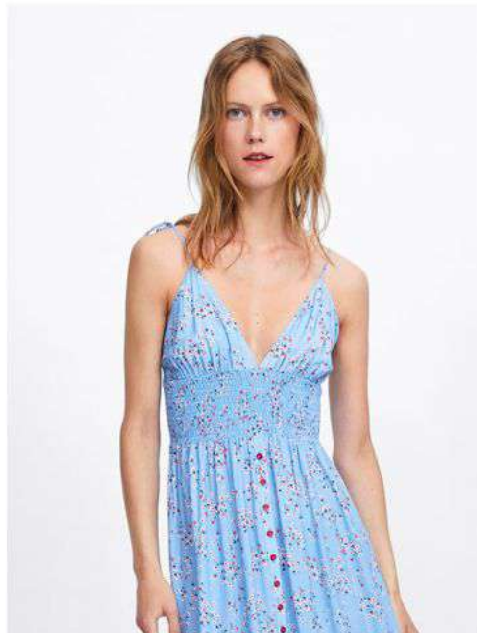
ПЛАТЬЕ-РУБАШКА ИЗ ХЛОПКА И ШЕЛКА С ПОЯСОМ 10 000 Р