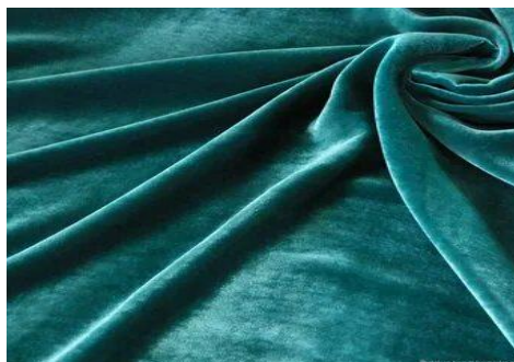
Рисунок 2.3 – велюр

Велюр - мягкая, ворсовая ткань, имеющая в своем составе натуральные волокна. Это: шерсть, хлопок, полиэстер. (рис 2.3)