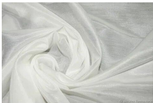
Рисунок 2.5 – батист

Химический состав: Хлопок (C 6 H 10 O 5 ) + лён Na 2 Fe 5 [Si 4 O 11 ] 2 (OH) 2 .