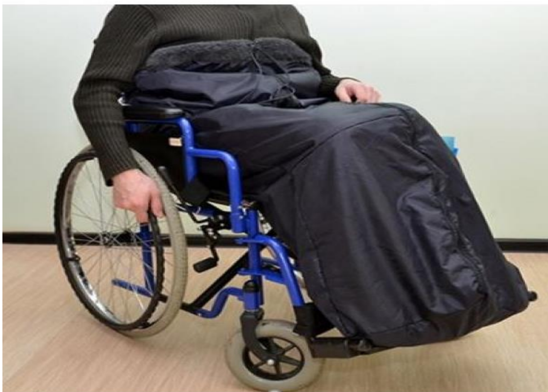
Рисунок 2.1 – чехол-куртка для инвалидов

Представлены чехлы, куртки мешки для людей, которые передвигаются на инвалидных колясках для сидячего типа фигуры (рис 2.1)