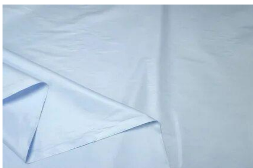
Рисунок 2.6 – тик

Для полного соответствия материалов требованиям к одежде ЛОВ и придания им различных свойств в их состав добавляют и другие волокна, например, лайкру, эластан, или спандекс. В этом случае одежда приобретает гибкость и становится более растяжимой, сокращая сминаемость и повышая комфорт. Именно ткани-стрейч будут обеспечивать эластичность модели и гигиеническое соответствие материала. (см. табл. 1.3)