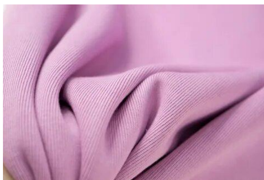
Рисунок 2.4 – рибана

Рибана - прочная ткань, которая отлично держит форму и окрас. Материал не содержит аллергенов, поэтому не вызывает зуда или раздражений кожи. Состав: 95% хлопок, 5% лайкры. (рис 2.4)