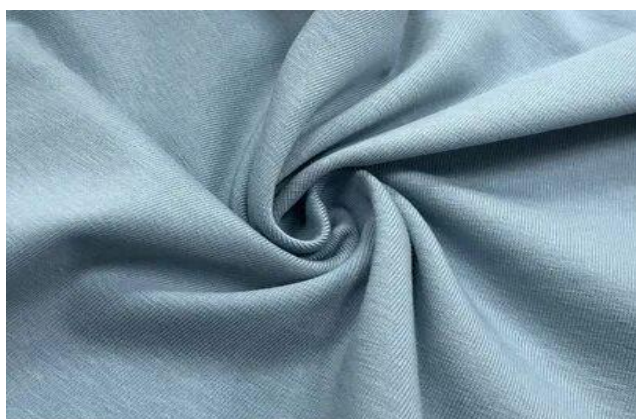
Рисунок 2.2 – кулирка

Кулирка – это 100% хлопковый материал. С добавлением эластана (лайкры). Такая ткань на 30% более прочная, износостойкая, удобная. Она лучше тянется, не садится при стирке, не линяет, не выгорает на солнце. (рис 2.2)