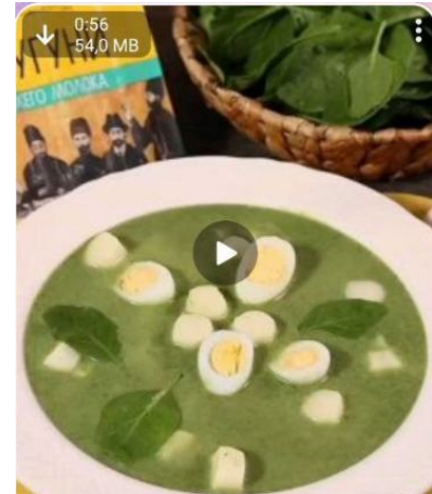
Суп Шечаманды с сыром ✨