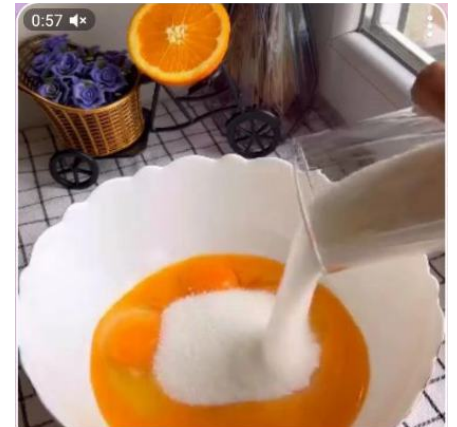
Апельсиновый пирог 🍊