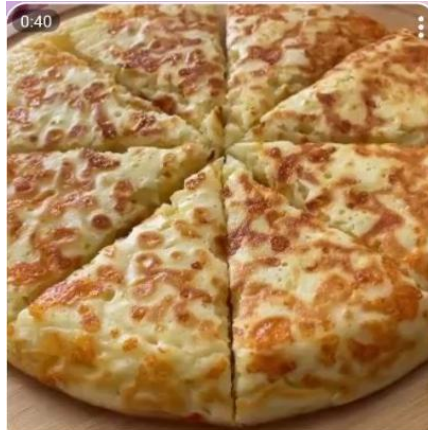
Ленивый хачапури 🍷