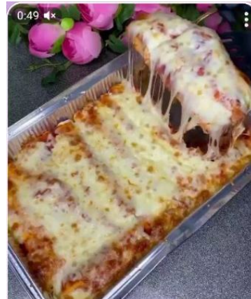
Мексиканская энчилада ✨