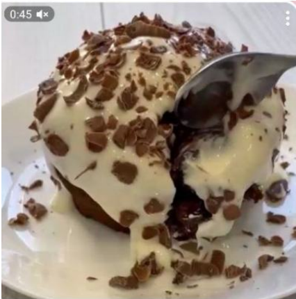
Шоколадное пирожное 🍫