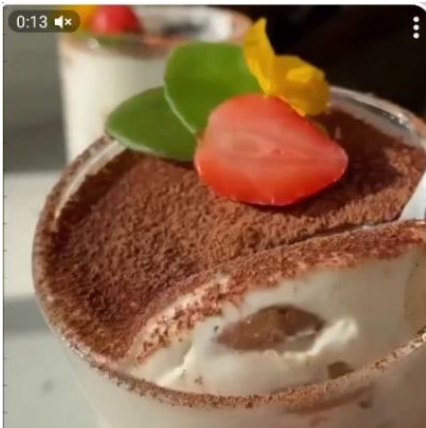
Тирамису за 10 минут 🍰