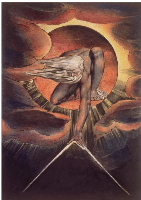
Уризен или Демург в живописи Уильяма Блейка.

Карпократ (II век н. э.) — представитель гностического движения, основанного на идеях свободы воли и равенства полов. Он был одним из первых гностиков, который создал свою собственную систему верований, основанную на идее свободы воли. Карпократ считал, что человек может достичь спасения через познание истины о себе и мире. Он также утверждал, что все люди равны перед Богом, независимо от их социального положения или пола. Согласно Карпократу, человек обладает свободой воли и может выбирать свой путь в жизни. Он может следовать добру или злу, но в конечном итоге он должен прийти к познанию истины о себе и мире. Это достигается через понимание того, что материальный мир – всего лишь завеса перед действительной реальностью. Карпократ также выступал за равенство полов. Он считал, что женщины и мужчины равны перед Богом и могут достичь спасения одинаково. Это было радикальной идеей для того времени, когда женщины считались неполноценными существами.