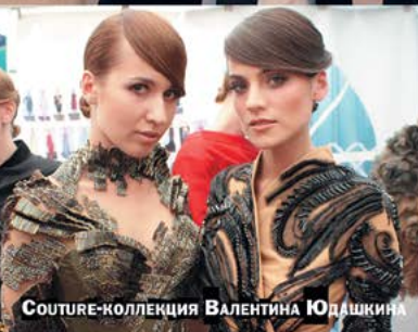
СОУТУРЕ-КОЛЛЕКЦИЯ ВАЛЕНТИНА ЮДАШКИНА