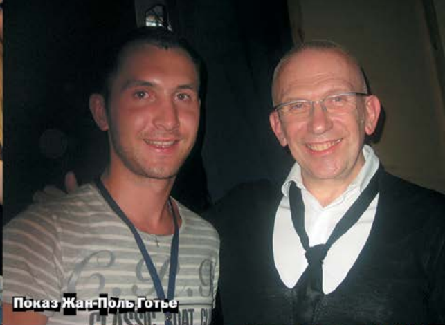
Показ Жан-Поль Готье