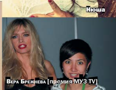
ВЕРА БРЕЖНЕВА [ПРЕМИЯ МУЗ TV]