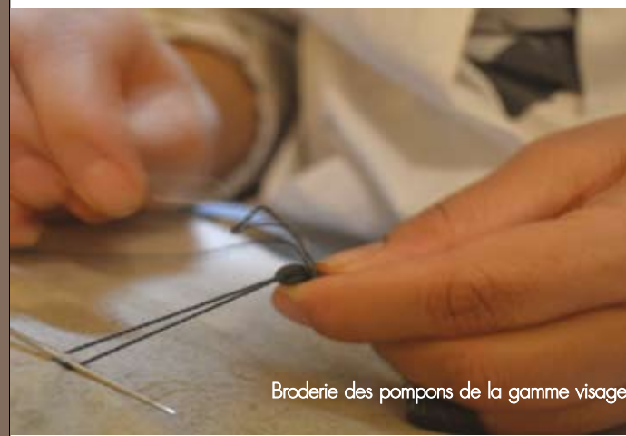
Broderie des pompons de la gamme visage