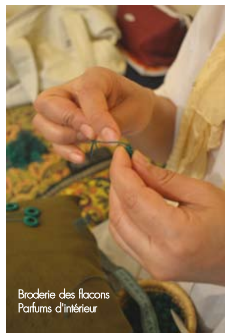
Broderie des flacons Parfums d'intérieur