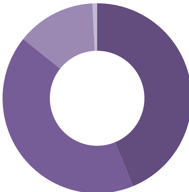
Рисунок 1. Основной источник профессиональных знаний фрилансеров.

Источник: Global Freelancers Survey 2010