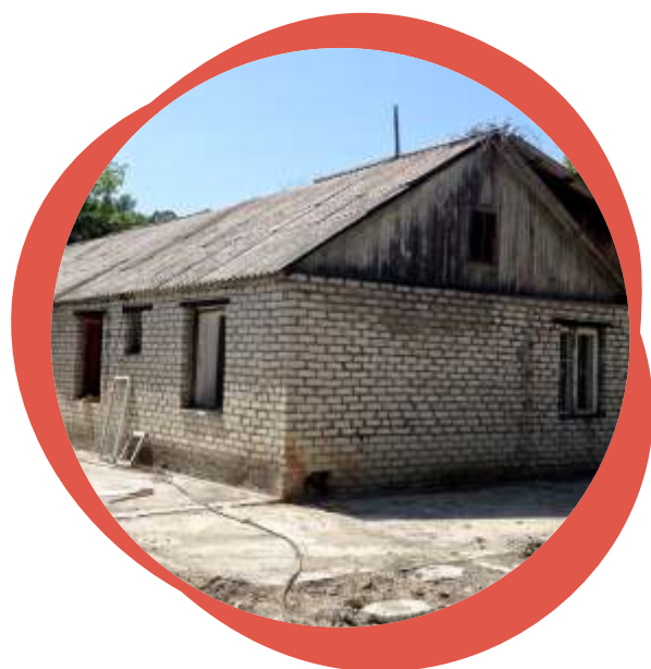
до начала работ

Сотрудничество с управляющей компанией длится до тех пор, пока в этом есть необходимость для стабильного функционирования и уверенного развития объекта СКК.