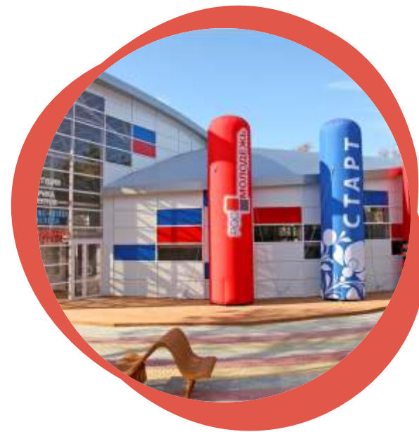
готовый объект после сдачи