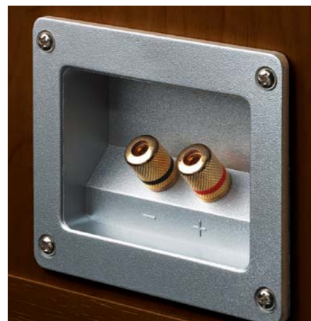
1 | Monitor Supreme 2500 c 8"