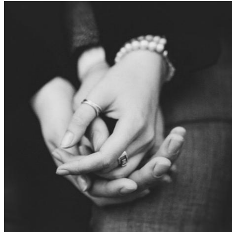
Тепло наших рук