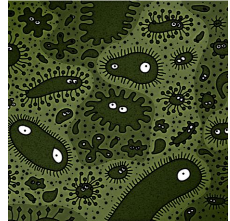
Кто живет на вашей кухне?