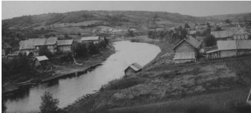
Vinnitsan piirin keskusta. Vuonna 1926.

helpompi mukauttaa vepsän lapset jatkokoulutukseen vain venäjäksi. Mutta tämäkin on käytännössä epäonnistunut: ei ollut riittävästi pätevää ihmisiä olemaan vepsän opettajia. Niinpä Vinnitsa kansallisessa alueella vain 174 lasta oppivat ensimmäisellä luokalla vepsän kieltä.