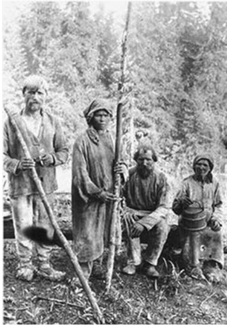
Vepsäläinen perhe työssä metsässä