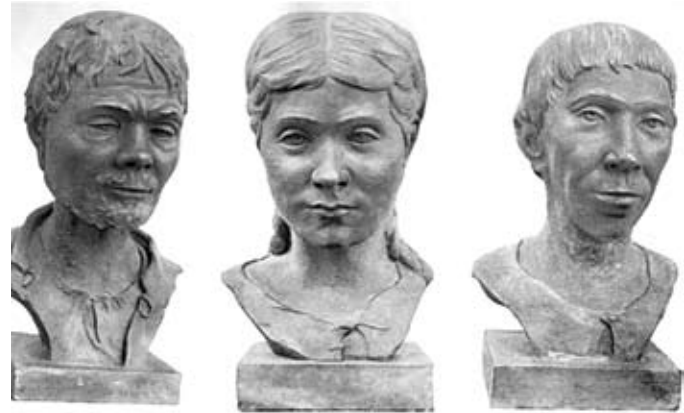
M.M. Gerasimovin muinaisten vepsäläisten jälleenrakennus. (V.V. Pimenov. Vepsäläiset. Essee etnisen historiasta ja kulttuurisen alusta. M.-L. 1965).

Kaikki kylät Oyat reuna, kuvauksen mukaan vuonna 1496 olivat malodvornymi. Periaatteessa yksi-kaksi pihoilla, hyvin harvoin löytyy kuvaukset kylä kolme pihoilla. Itse asiassa, sana kylä, joka perinteisesti ollut tottunut siihen tässä siirtokuntia, virheellisiä ja epätarkkoja. Se ekstrapoloi tuttuja käsitteitä Venäjän Veps todellisuuteen. Se, että alue on nimeltään Oyat kylä – nämä ovat tyypillisiä hutora. Tochno samat maatila,