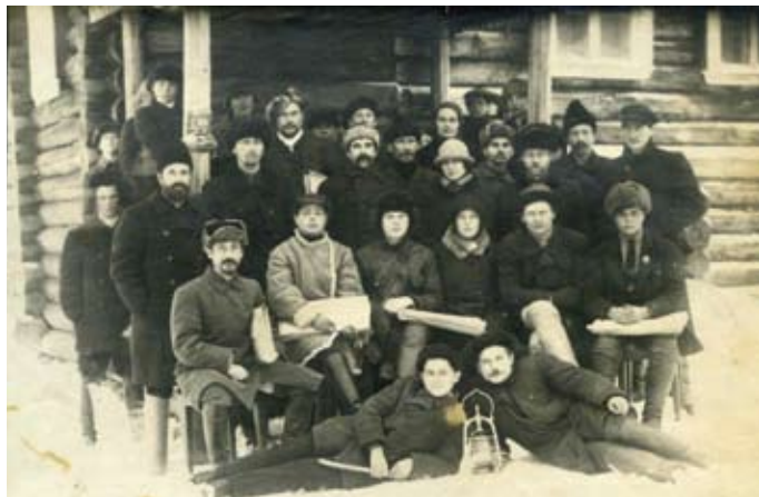
Vinnitsan alueen väestönlaskennan komissio. Vuonna 1926.

Vuoteen 1937 Neuvostoliiton viranomaiset lopulta putosi maskin, ja kansallinen kysymys on myös osoittanut todelliset kasvonsa.