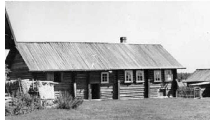
Talo Barsky Sarozerossa. Vuonna 1972.

Vepsän kotiin erosi naapurit ja yhteyden asuin- ja liikerakennusten läpi siirtyminen – «uuk», «tanazpordhad» ylimääräistä “takapihalla” katos, jolla on oma katto, joka ei ollut tyypillinen rakennusten vieressä asuvien Karjalassa ja Venäjällä.