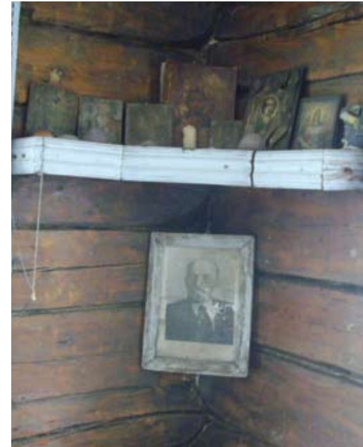
“Punainen nurkka” vepsäläisessä talossa v.1920

Miten rakentetaan taloa metsässä tämän metsän puista? Miten tehdään virsut ja mistä materiaalista? Miten voi repiä puiden kuoren, miten kehrätään villan kuitua, jotta voi virkata lämpimiä vaatteita talviksi? Miten kutoa matto lattialle, jotta lapset voivat leikkiä talon lattialla talvena? Miten ja mistä tehdään puisia astioita? Miten nokkosesta tehdään kangasta, josta voi ommella paitaa (meidän kokoelmastamme löytyy yksi sellainen ainutlaatuinen paita). Miten voi seurata karhua ja sitten tehdä karhun nahkaa? Miten säilyttää poron lihaa, jos ei ole sähköä ja jääkaappia. Itse