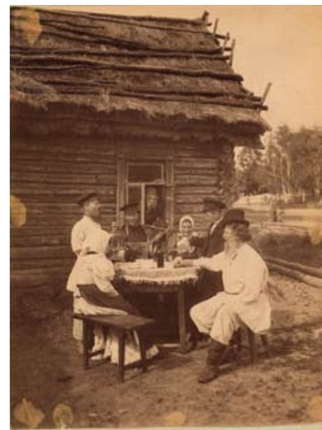
Vepsäläinen perhe istumassa ja juomassa teetä. XIX vuosisadalla lopussa.