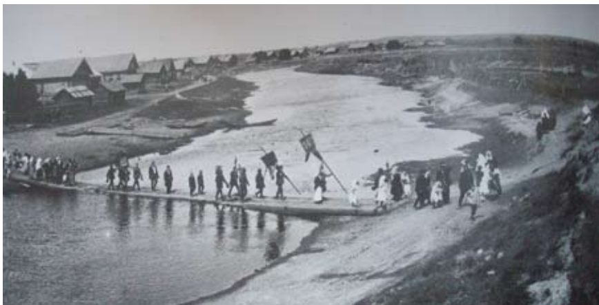
Ristisaatto Vinnitsyssä Ojatti-joen kautta. XIX-vuosisadan lopulla.

Loppuun mennessä XV luvulla, kaikki maan Obonezhie ja myös Ojattin maalle tuli omaisuutta Novgorodin boyars ja luostareita, ja yhdessä tämän, paikallinen väestö on tullut riippuvainen näistä omistajille.