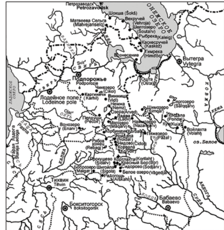
Vepsäläisten asutuksen leviäminen

Tämä kirja kertoo vepsäläisistä asuvia Ojatissa. Seuraavissa luvuissa yritämme tarkentaa Ojatin reunan historiaa, esim. taloudesta alkaen tämän