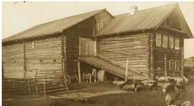
Vepsäläinen mökki. XX - vuosisadan alussa.

Vepsän kotiin erosi naapurit ja yhteyden asuin- ja liikerakennusten läpi siirtyminen – «uuk», «tanazpordhad» ylimääräistä “takapihalla” katos, jolla on oma katto, joka ei ollut tyypillinen rakennusten vieressä asuvien Karjalassa ja Venäjällä.