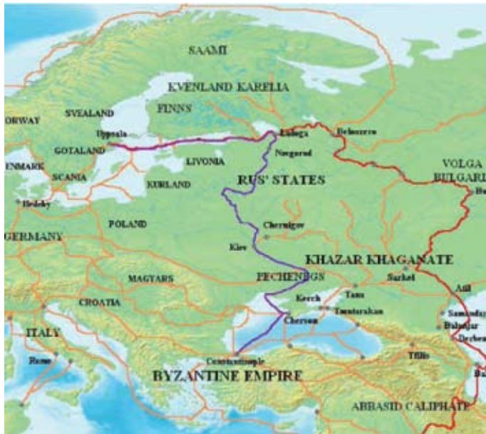
Kartassa näytää Suuren Volga jokireitti. Se menee vepsäläisen alueen läpi, Mezhozeryessa Äänisjoelta Laatokkaan asti ja eteenpäin.

Volga kauppareitti oli ristissä pohjoisesta etelään, niin että matka ulottuu yli monta viikkoa, ja se oli vaarallista. Lisäksi asuntovaunut teki välilaskun yöllä, ihmiset laskeutuivat rannalla. Näinä hetkinä paikallinen väestö tutustui slaaveihin, kreikkalaisiin ja skandinaaveihin.