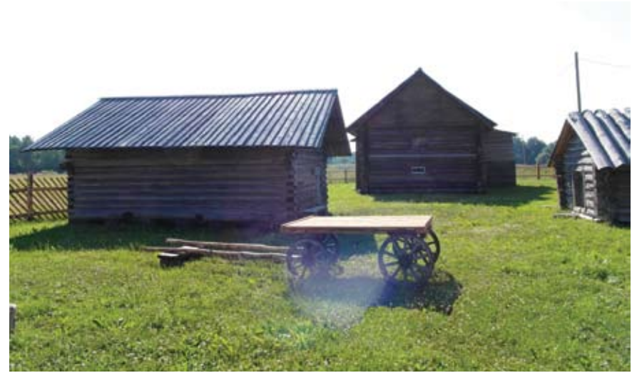
Vepsäläisen elämäntavan museo Sarozerosssa.