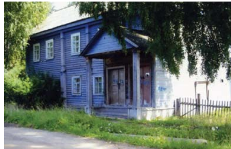
Kalkasovin talo, joka on säilyttänyt alkuperäisen ulkoasun vuonna 2014 . Kooperativsnaya Katu, 7.