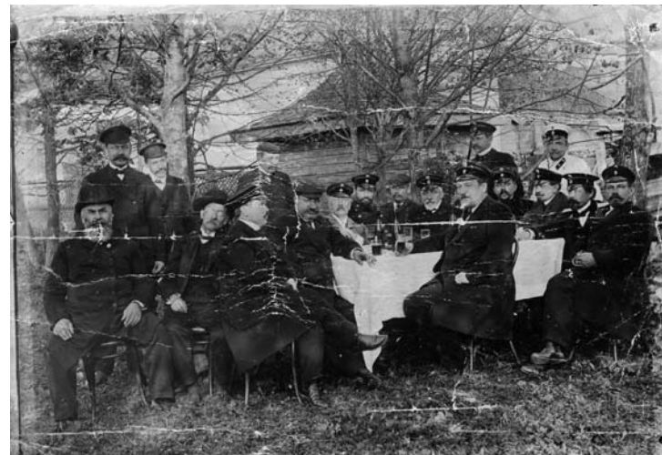
Lotinapellon kirkkokunnan virkamiehet. XX vuosisadan alussa.

Päätoimen väestöstä oli maatalouden, metsätalouden ja hyödyllisyys teollisuudelle.