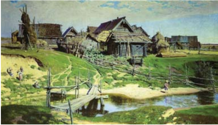
Ojatin kylä. Vasily Polenov

Osana Novgorodin valtion Oyat reuna on niin kauan kuin hän Novgorodiin, jossa kaikki sen laaja mailla ole osoittautuneet vallannut Moskova ruhtinaskunta.