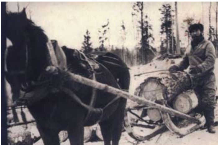
Perinteinen vepsäläisten puunkorjuun

Vuonna 1648 se on muodostunut Olonetsk haaste kota, joka muutti pikkukaupungissa Aunuksen.