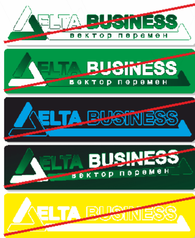
Недопустимое использование логотипа