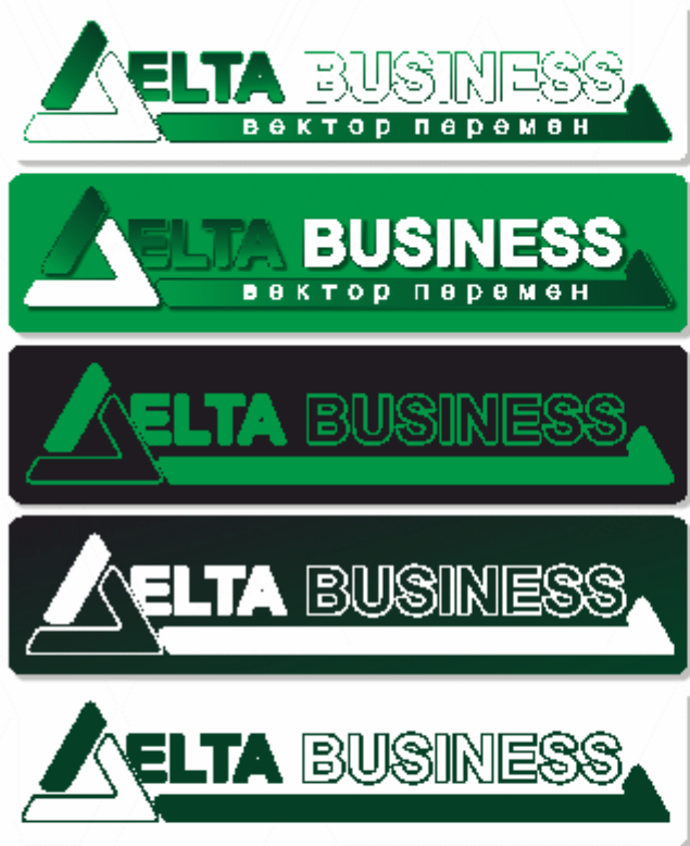
Корректное использование логотипа